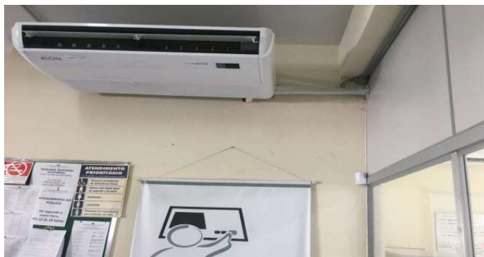
Após a instalação de ar-condicionado

Obs: Informar o trabalho e o ambiente onde executados os serviços