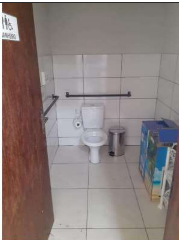
Antes da execução da retirada de barras de apoio (desconformes)

(os serviços e as imagens são meramente ilustrativos e não se resumem aos exemplos abaixo)