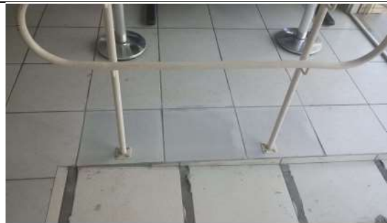
Após a substituição do piso

Obs: Informar o trabalho e o ambiente onde executados os serviços