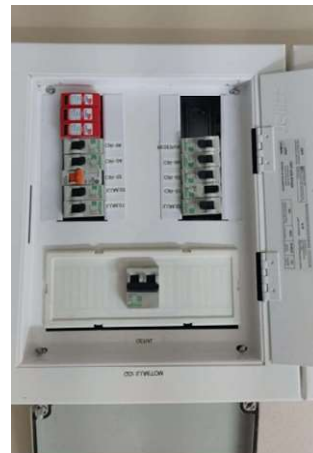
Após a execução dos serviços

Obs Informar o trabalho e o ambiente onde executados os serviços