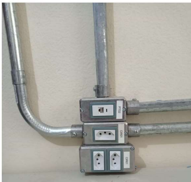
Obrigatória a identificação de pontos elétricos e lógicos