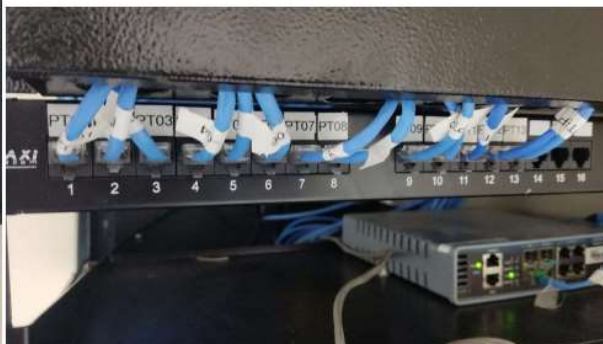
Instalação de rack e patch panel, com identificação OBRIGATÓRIA de cabos