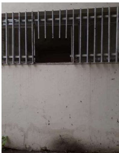
Desinstalação de ar- condicionado ACJ

Obs: Informar o trabalho e o ambiente onde executados os serviços