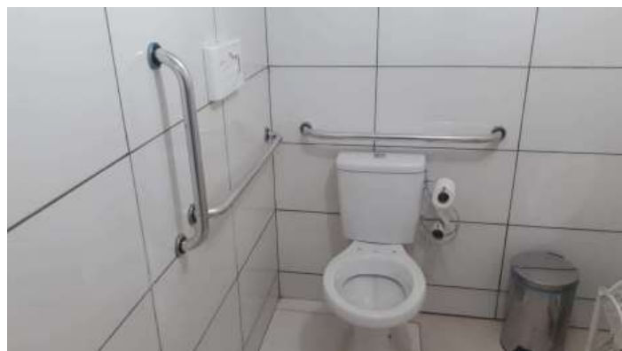
Após a correção

Obs: Informar o trabalho e o ambiente onde executados os serviços