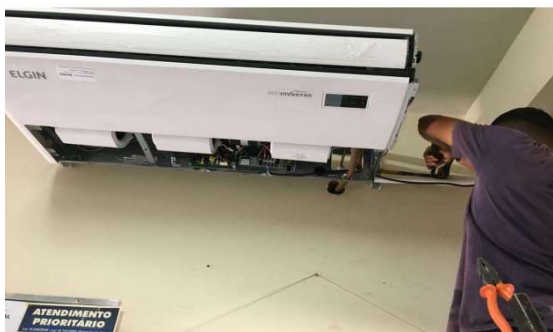
Antes da instalação de ar-condicionado