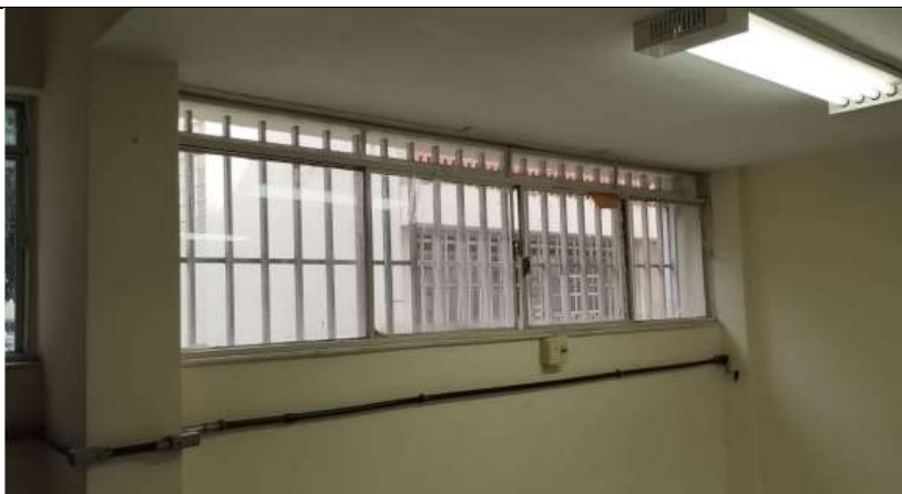
Após a execução (Recomposição de grades/paredes e pintura)

Obs: Informar o trabalho e o ambiente onde executados os serviços