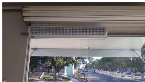
Após a instalação do equipamento

Obs: Informar o trabalho e o ambiente onde executados os serviços