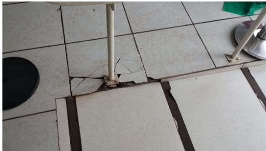
Antes da execução (correção de piso cerâmico)