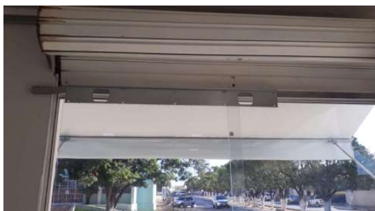
Antes da instalação de cortina de ar

Obs: Informar o trabalho e o ambiente onde executados os serviços